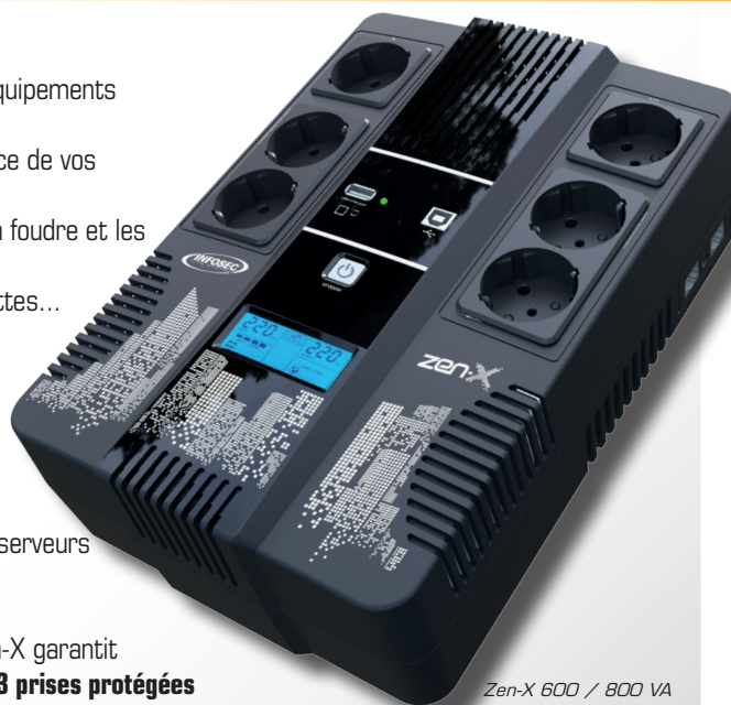
Zen-X 600 / 800 VA